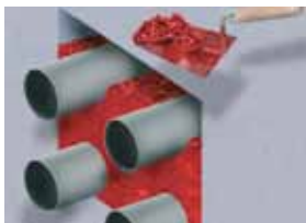
Omietanie priestupov potrubí