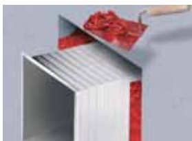
Omietanie vzduchotechnických rozvodov