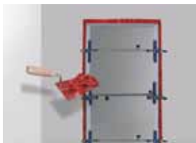
Murovanie protipožiarnych dverí